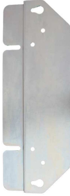
Рис. 2 Крепежная планка

Для размещения стабилизатора на стене сначала монтируется крепежная планка (Рис.2), потом на нее подвешивается аппарат и производится подключение токоведущих проводников. Предварительно на стабилизатор необходимо установить опорную планку (Рис.3).