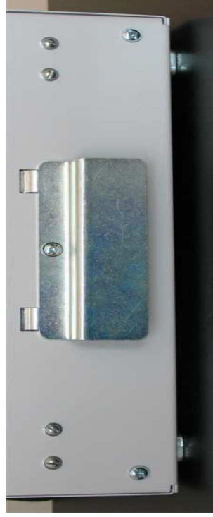
Рис. 3 Упорная планка